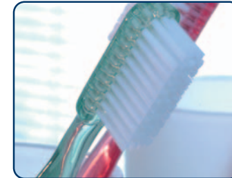
Gebruik een zachte tandenborstel

beperk dit dan tot één keer per dag. Wacht met het reinigen van uw gebit na het eten of drinken van zuur tenminste een uur.