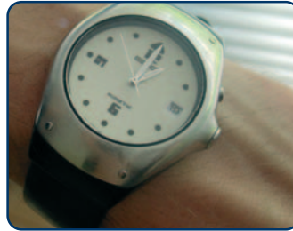
Wacht met tandenpoetsen tenminste een uur, na het eten of drinken van zuur

Het oppervlak van tanden en kiezen wordt zachter door de inwerking van zuur. Als u direct na het eten of drinken van zuur uw tanden poetst, kunt u de glazuurlaag gemakkelijk wegpoetsen.